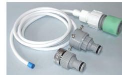
どこでも給水コネクタ