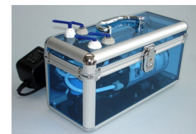
ブースターポンプユニット (*)