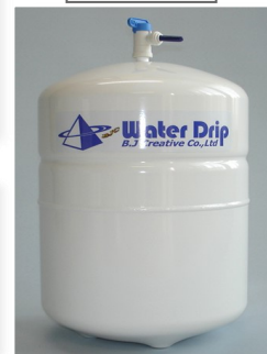
プレッシャータンク (*)