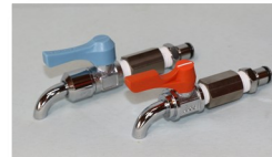
らく楽フォーセット